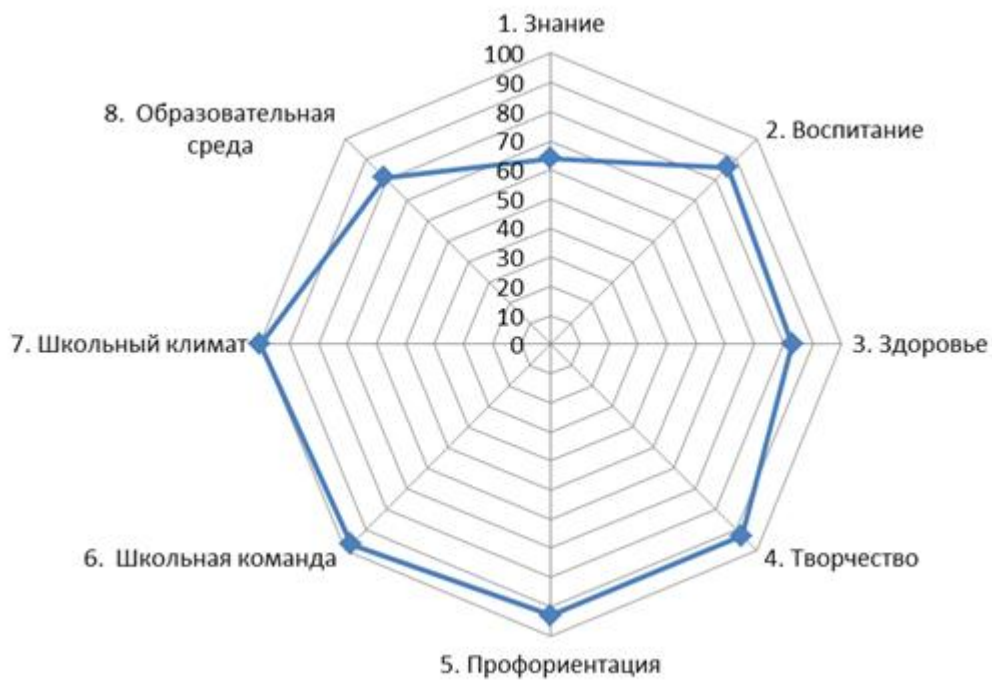
Диаграмма 1 «Результаты самодиагностики школы» (июнь, 2024)

По итогам самодиагностики школа показала высокий уровень. Однако есть критерии, по которым были выявлены дефициты. В целом результаты диагностики по направлениям и ключевым условиям представлены в виде лепестковой диаграммы (Диаграмма 1).